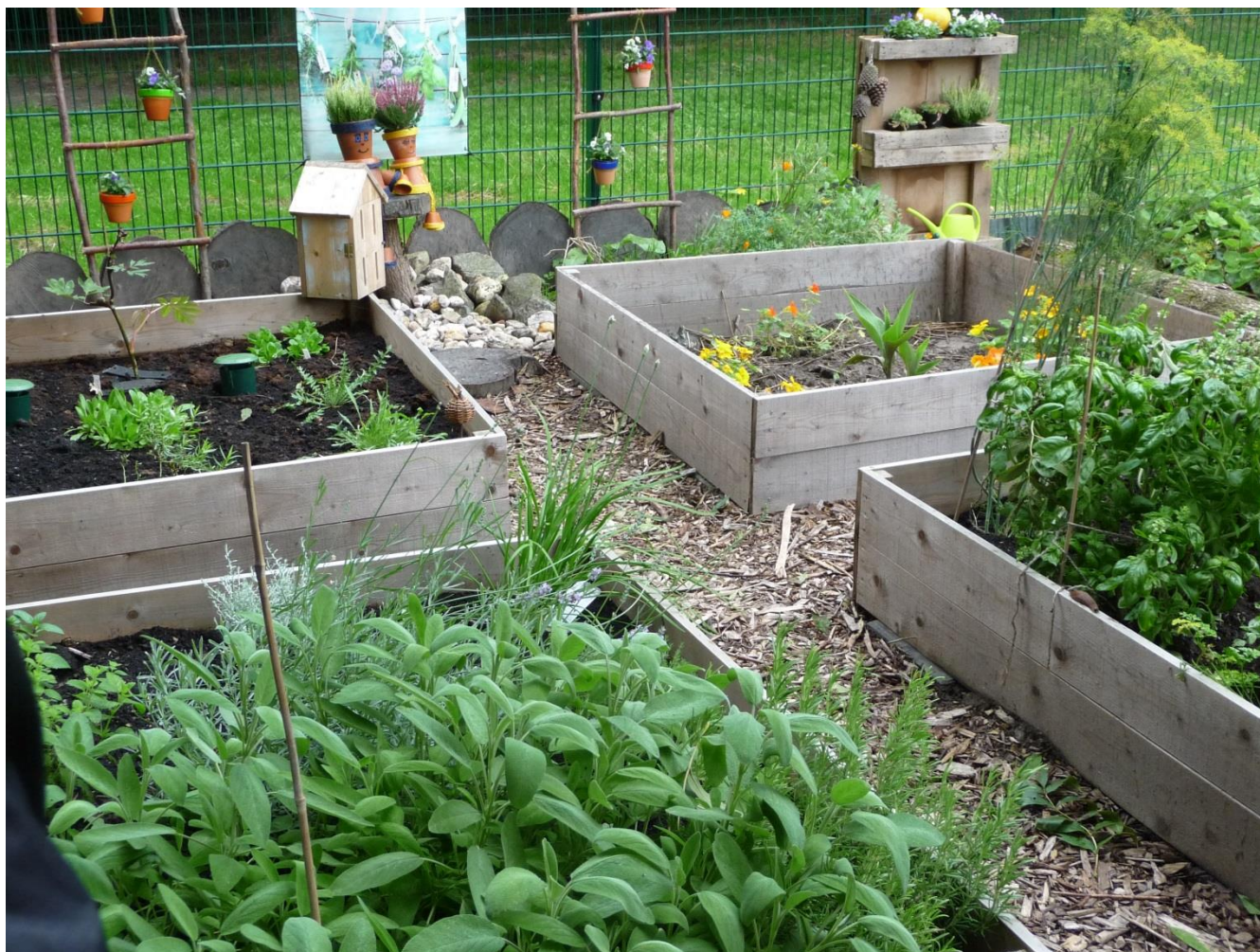
Tuin in Helvoirt, bezocht 30 augustus 2014

In de gemeente Heusden zijn tenminste drie samentuinen, één per grotere kern. Een samentuin functioneert als een zelfstandige eenheid; het staat de tuiniers vrij om hun eigen organisatievorm te kiezen. We stimuleren alle tuiniers en “vrienden” van de tuinen om lid te worden van de Natuur- en Milieuvereniging gemeente Heusden.