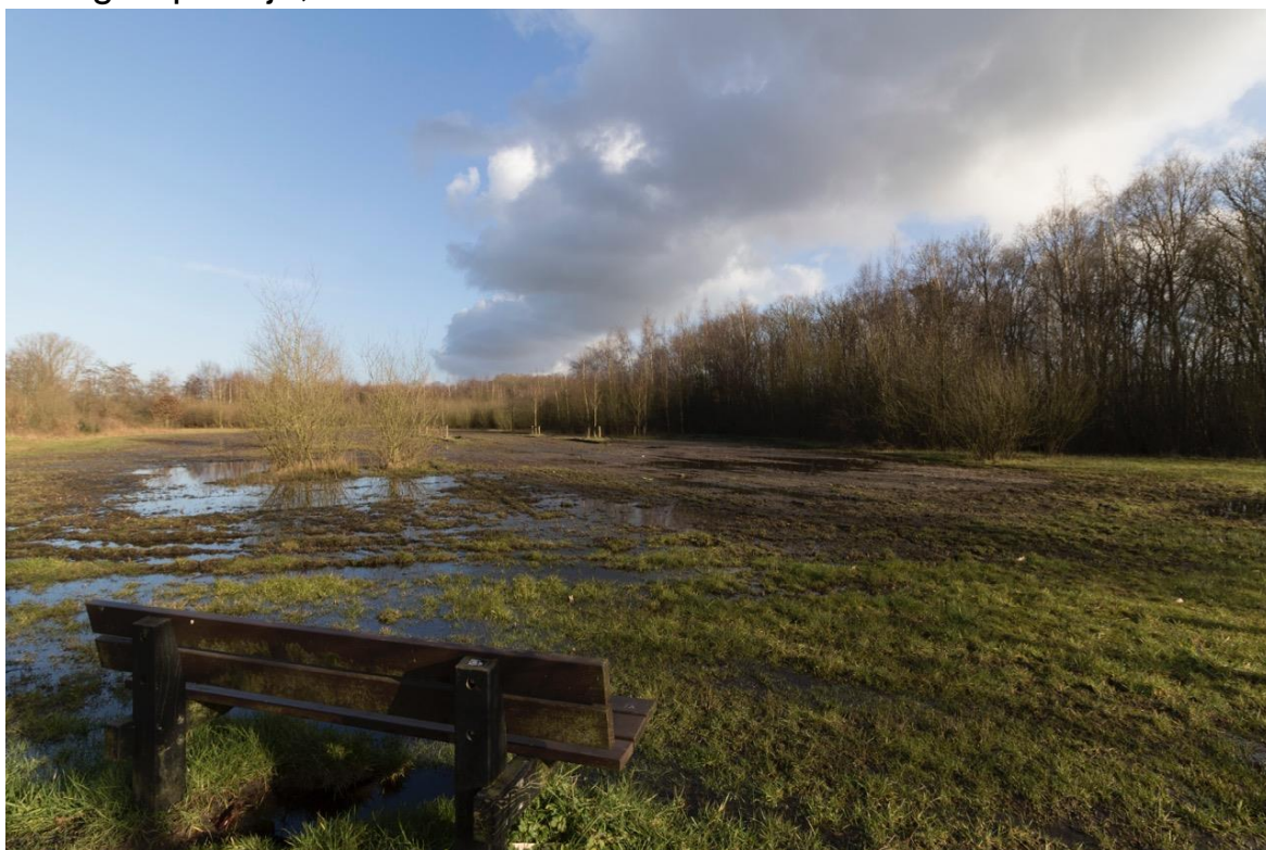
Vlinderveld – idylle