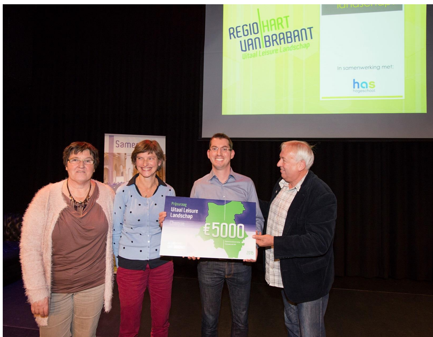
Vitaal Leisure Landschap prijsvraag