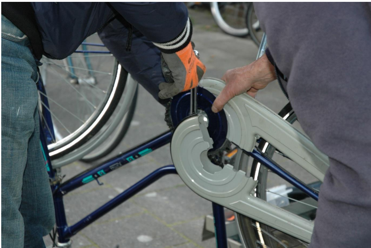
foto: reparatiekennis doorgeven