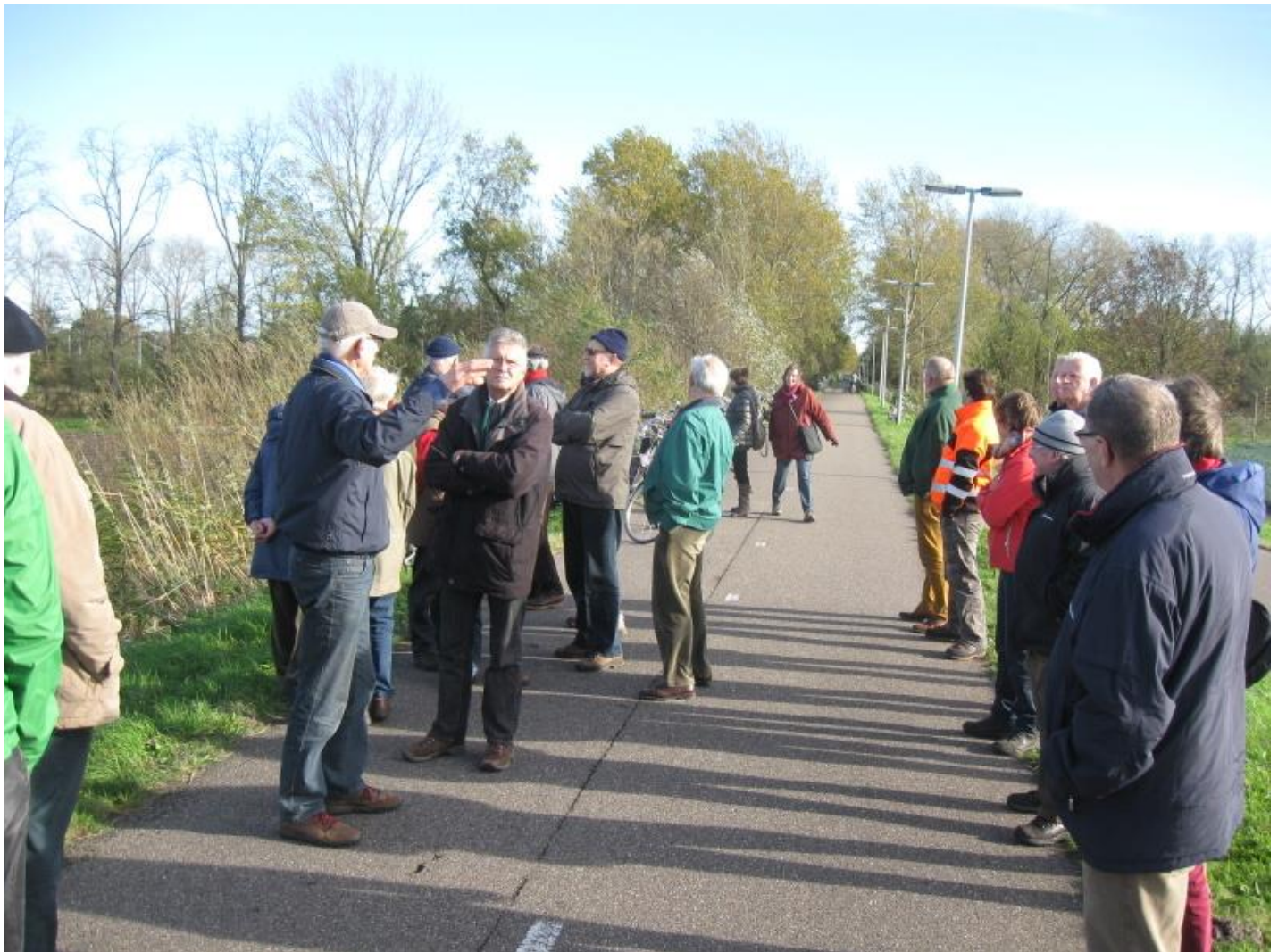
Rondje langs de werkgroepen nov 2014: ruimtelijke ordening over GOL vanaf de Spoordijk in Drunen