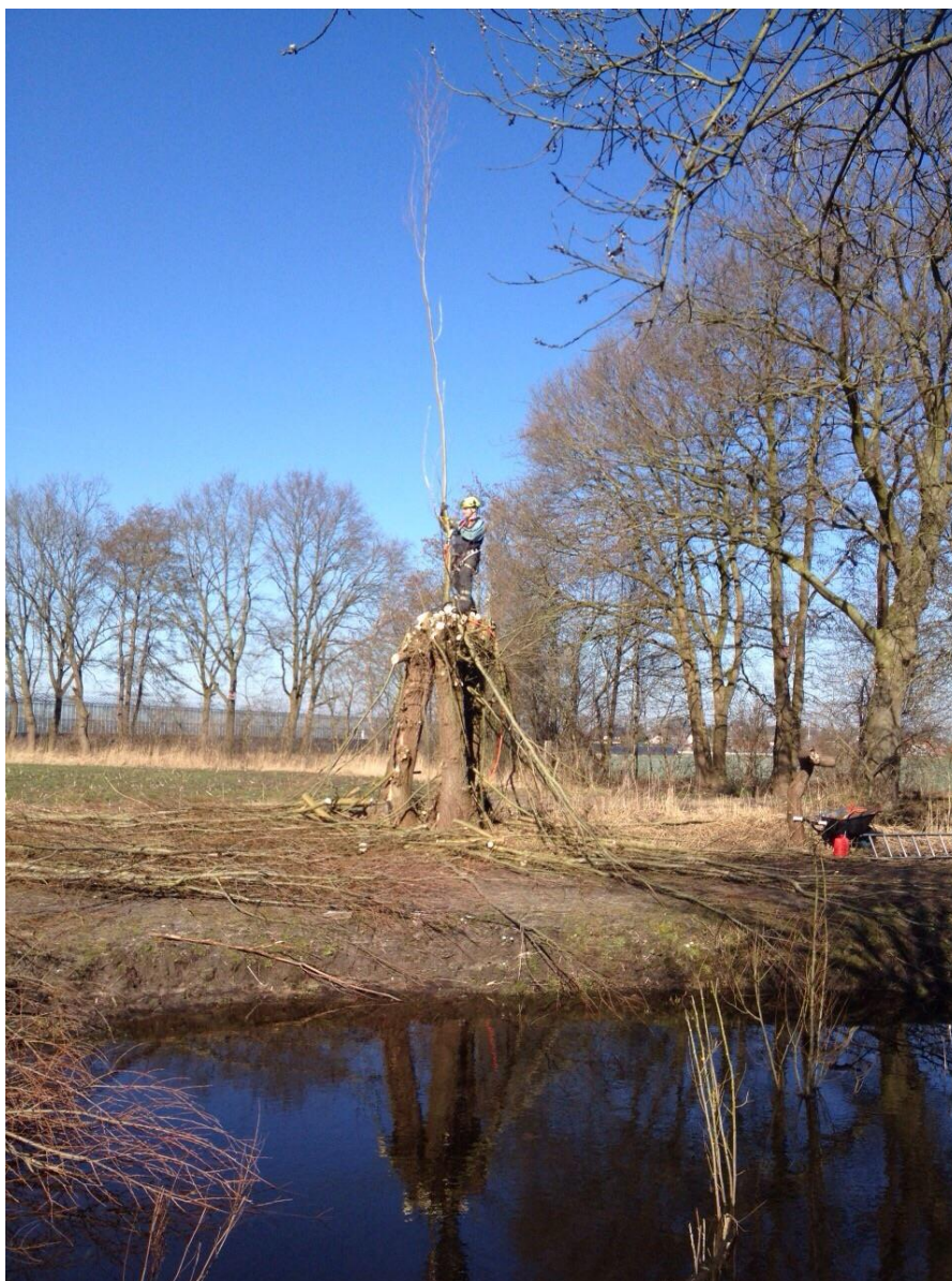
De Zwollemoer :wilgen knotten

Het gedachtegoed en de manier van werken van samentuinen wordt uitgedragen en ondersteund door Velt vzw, Berchem (B). De werkgroep heeft gekozen voor de uitgangspunten en werkwijze van Velt. Het motto van Velt is Samen Eco Actief; kijk op www.velt.nu voor meer over Velt.