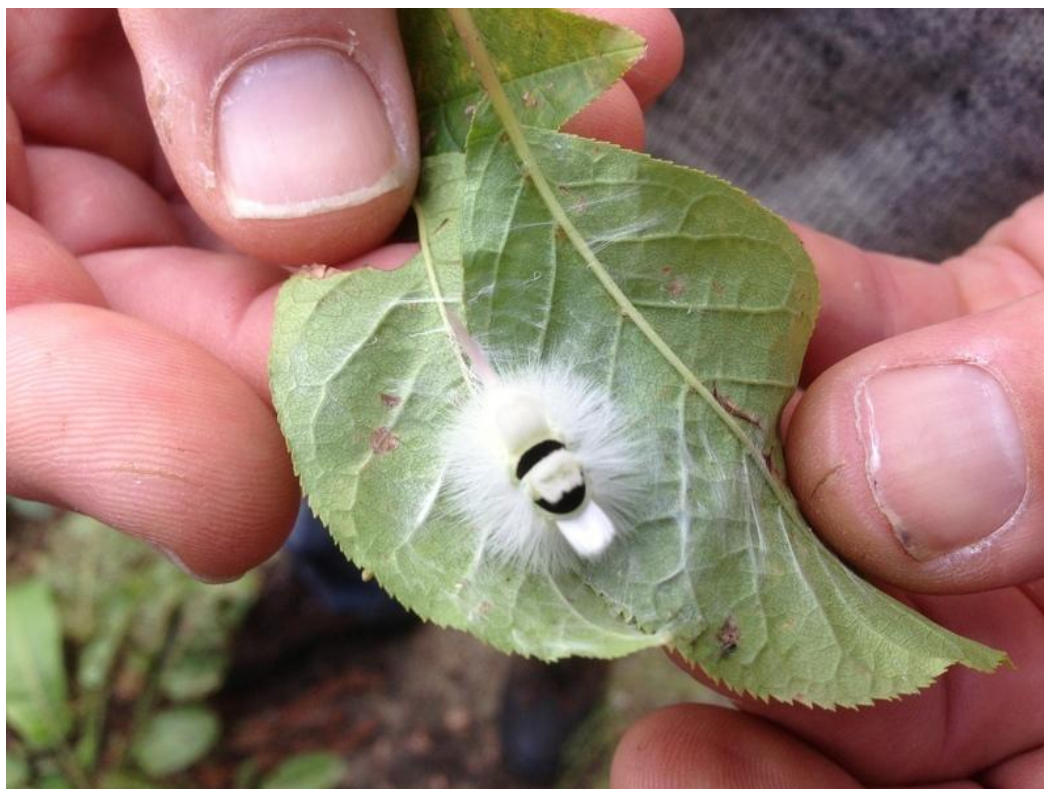
Rups van meriansborstel ( Calliteara pudibunda )