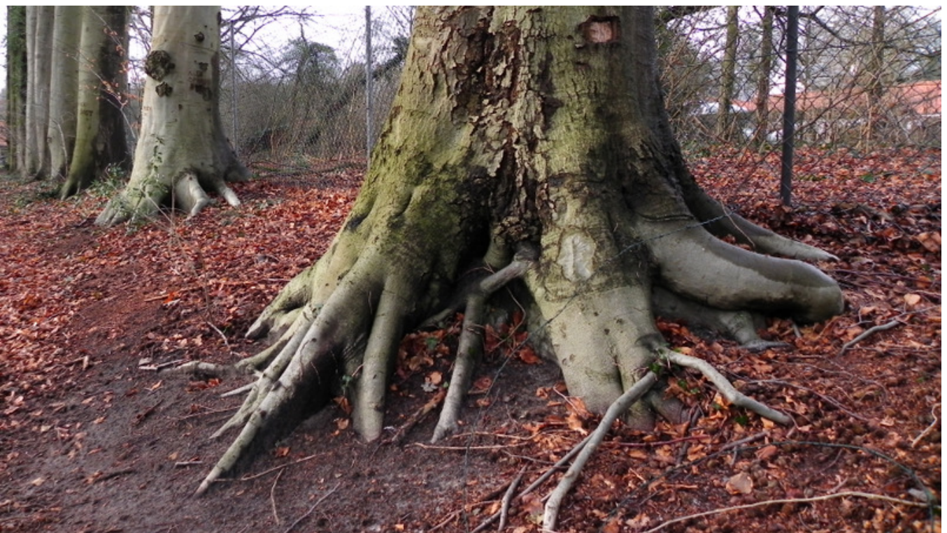
Aan de voet (Poort van Heusden)