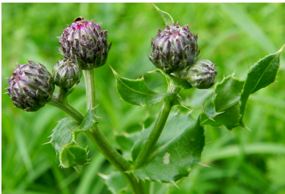
Akkerdistel in knop