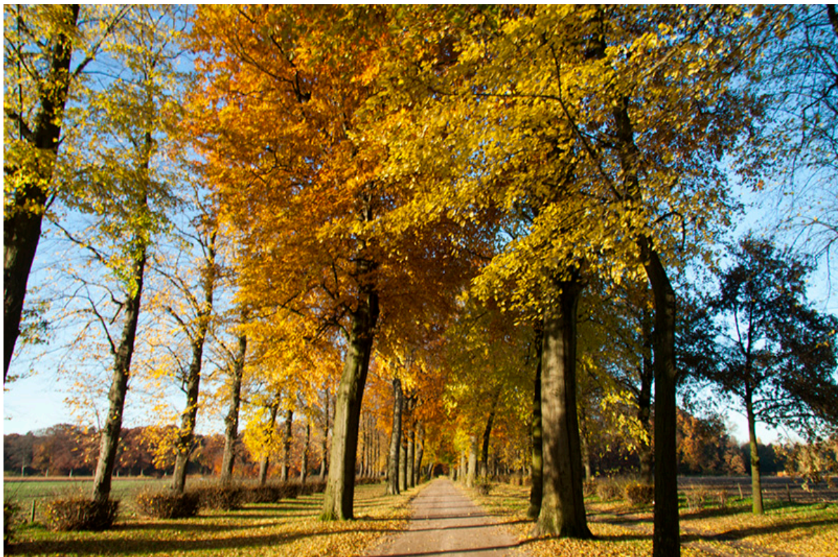
Kasteellaan in herfsttooi, Nieuwkuijk