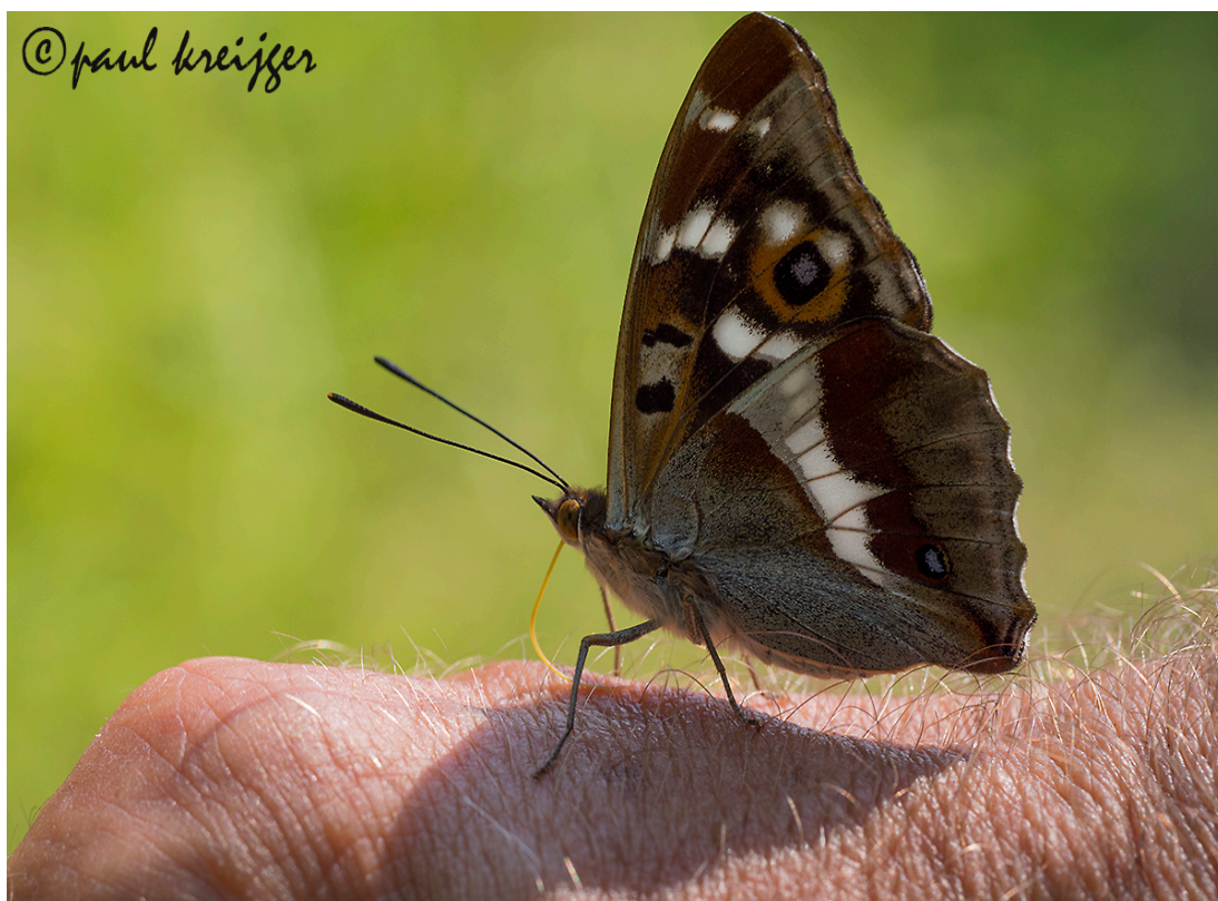
foto: grote weerschijnvlinder

Dat het toch nog goed zou komen met een groot aantal vlindersoorten, had ik in het voorjaar niet durven te voorspellen. We weten het nog maar al te goed, het voorjaar was koud. Het aantal rupsen in het voorjaar was ronduit slecht. Rupsen van de kleine wintervlinder, die normaal het bulkvoedsel voor de jonge vogels moet zijn, waren er nauwelijks. Met gevolgen voor de vogels die toen jongen hadden. Maar toen kwam juni en alles leek toch op zijn plek te vallen. Ik ben de derde week naar Noord Frankrijk geweest en wat opviel was, dat de eerste kleine ijsvogelvlinders reeds vlogen, ook een overwinterende rups, maar de vlinder vloog redelijk op tijd. Zelfs was er al een kleine weerschijnvlinder aanwezig. Maar de grote ijsvogelvlinder, waar ik feitelijk voor ging, was er (nog) niet. Wel veel kleine- en grote weerschijnvlinders. Ze kwamen op het zweet van mijn fiets af en gingen op mijn zweterige arm zitten drinken, het was tenslotte warm. Een gaaf gezicht, zo'n prachtige vlinder op je lijf.