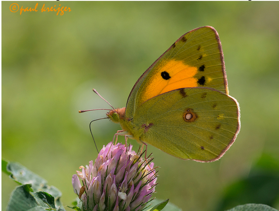
Foto: oranje luzerne vlinder