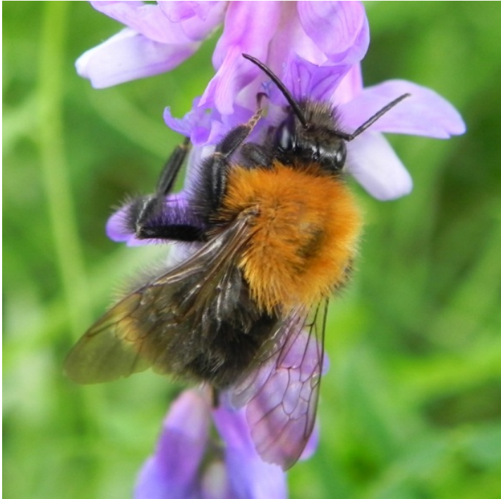
Weidehommel