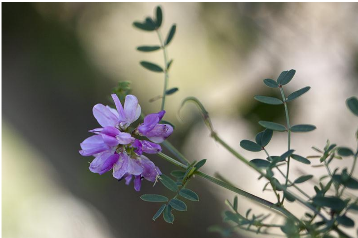
Wikke of bont kroonkruid