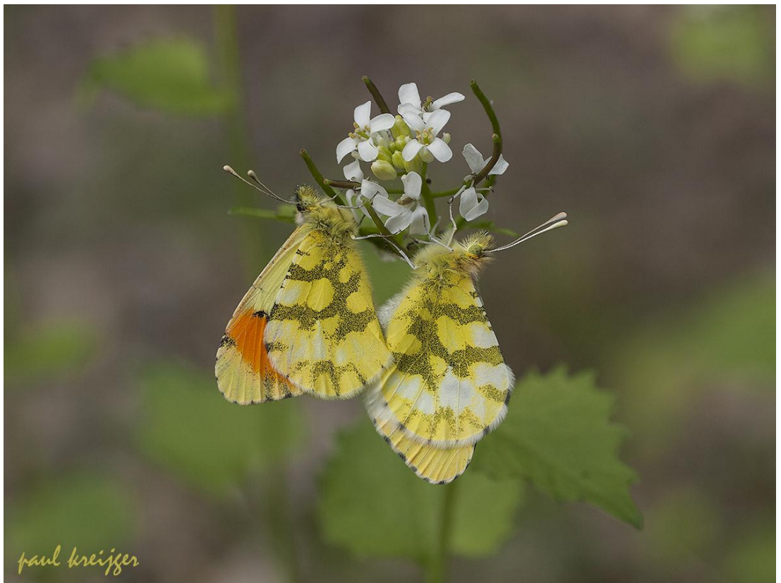
foto: gele oranjetipjes

Andere vroege soorten zijn de dagpauwoog, kleine vos en de gehakkelde aurelia. Dagpauwoog en kleine vos overwinteren ook als vlinder, beschut in onverwarmde schuren, zolders en kelders of in holten buiten. Gehakkelde aurelia overwintert ook als vlinder, meestal ook gewoon buiten tussen struiken of bladeren. De dagpauwoog heeft in principe ook maar een generatie en kan zodoende een behoorlijke leeftijd halen. Maar ook zij zijn een groot deel van het jaar aan te treffen en dus geen echte voorjaarsvlinders.