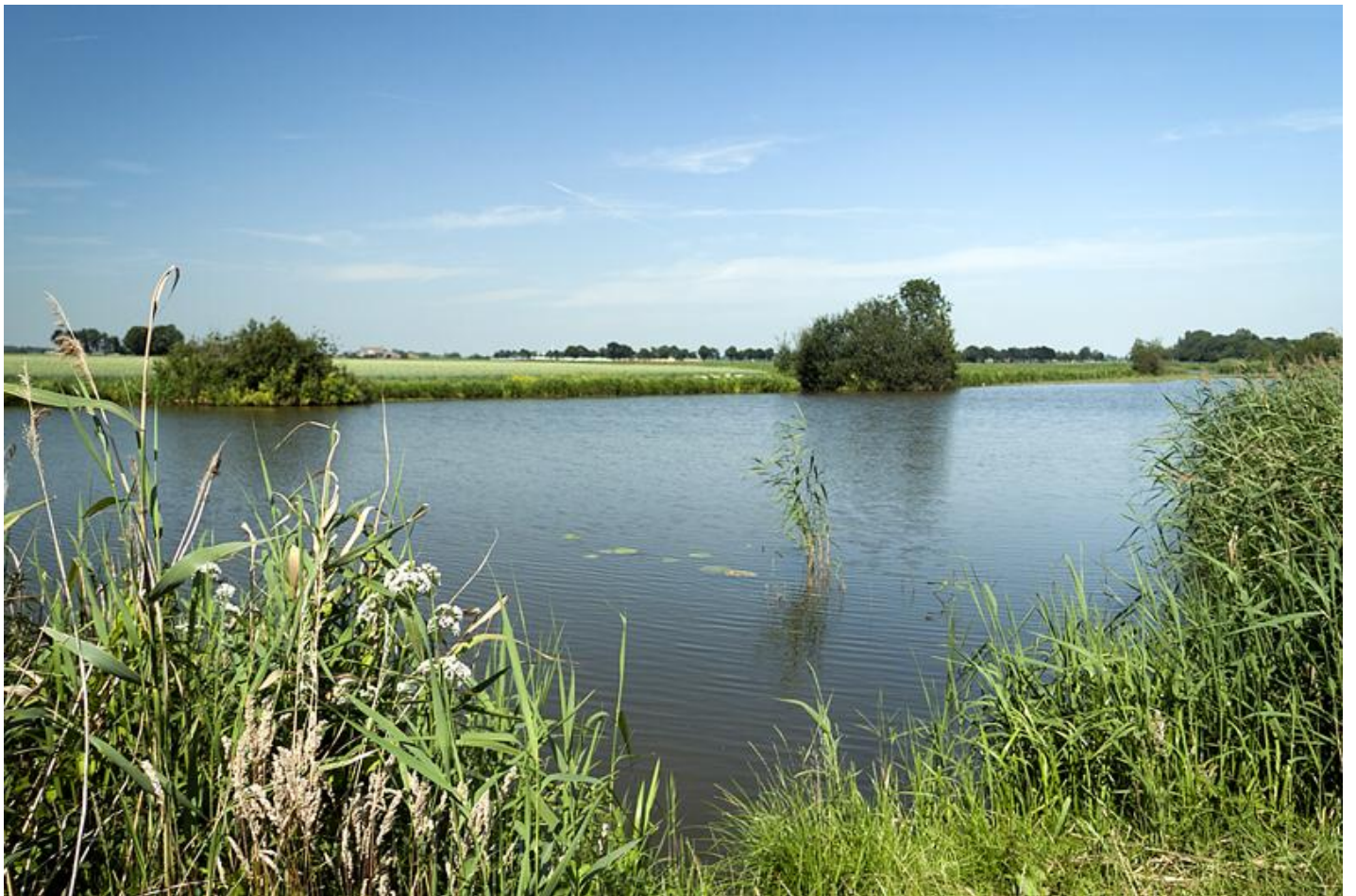
Oude Maasje bij Hedikhuizen