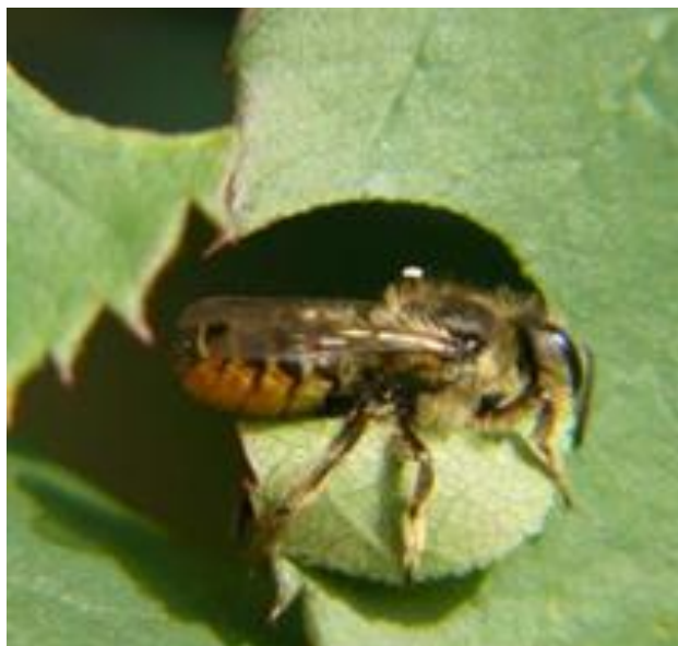
De behangersbij bezig met het uitknippen van een rozenblad