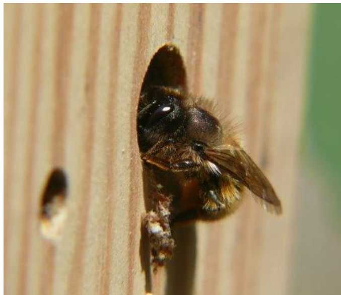
De Rosse metselbij bezig met het afdichten van de nestingang

De rosse metselbij is een vroege soort die we vooral zullen zien van april tot in juni.