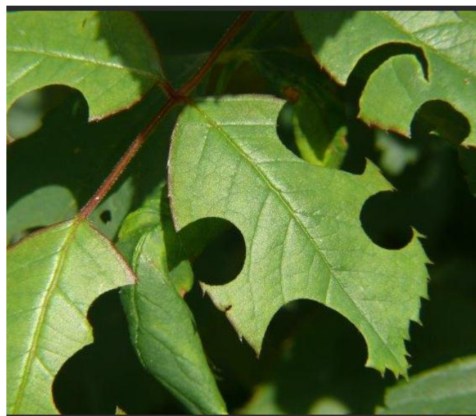
De rozenblaadjes na de behandeling door de behangersbij

Ook deze bij bouwt in de nestgang een aantal lineaire cellen. Als deze gereed zijn wordt de nestopening nog met een propje ronde bladstukjes afgesloten.