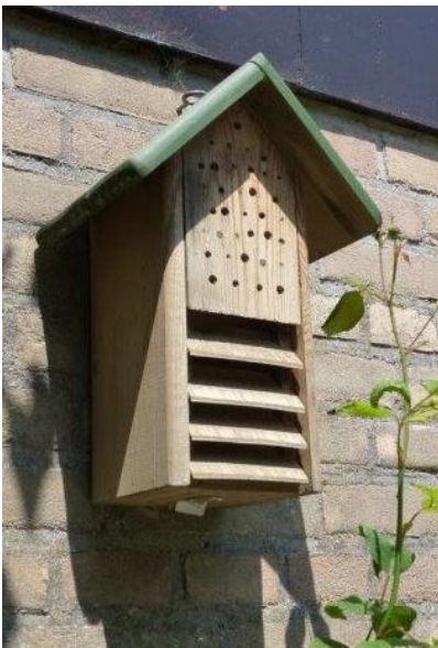
Insectenblok met verschillende gangdiameters. Een aantal openingen is al dichtgemetseld.

De opening wordt ook met een leemwandje dichtgemetseld.