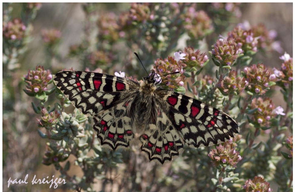
Foto: Spaanse pijpbloemvlinder met rode vlekjes

Koninginnedag niet zag vliegen. Het zijn de mannetjes die overdag het geurspoor van het vrouwtje volgen in een wilde vlucht vlak boven de grond. Dit jaar is alles even laat, dat zal ook voor deze vlinder gelden.