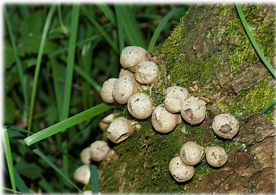
Stuifzwammetjes ( fotowerkgroep)