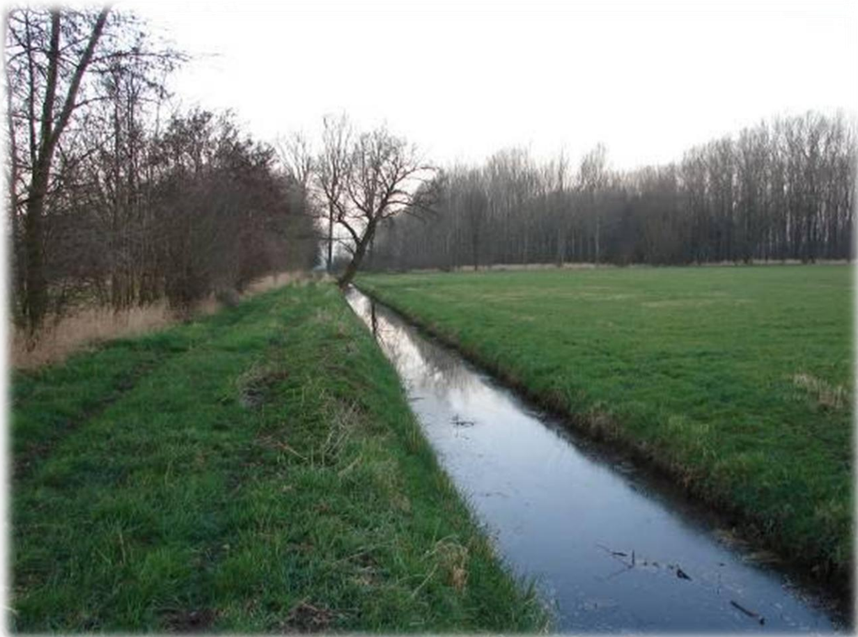
Populieren domineren het landschapsbeeld in de Hooibroeken

Beide gebieden hebben hoge natuur- en landschaps- en cultuurhistorische waarden en hebben een ruig karakter als gevolg van de voedselrijke bodem. Soorten als kleefkruid en brandnetel komen dan ook talrijk voor in deze gebieden.