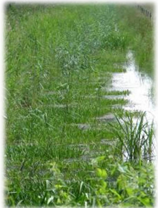
Sloot in de Hooibroeken met aangepast talud en Krabbescheervegetatie

Een forse verhoging van de waterstand kan ertoe leiden dat het kwelwater juist