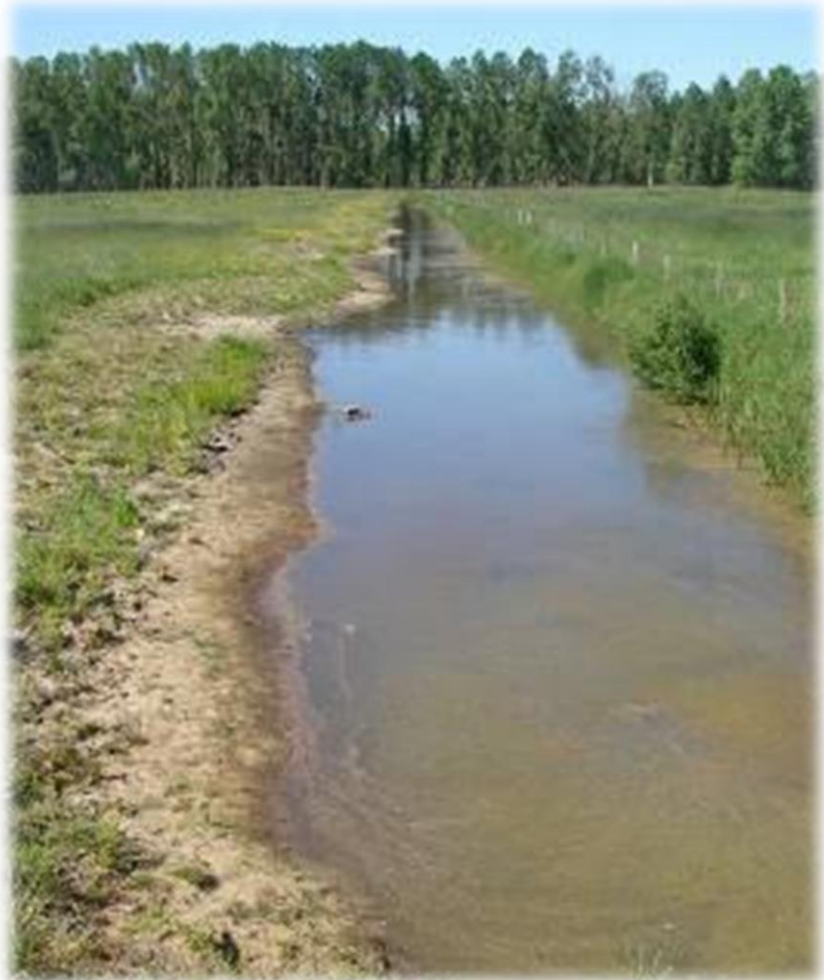
Sloot met aangepast talud

Ook is een stuw geplaatst in de afvoersloot van het gebied om water langer vast te houden in het gebied.