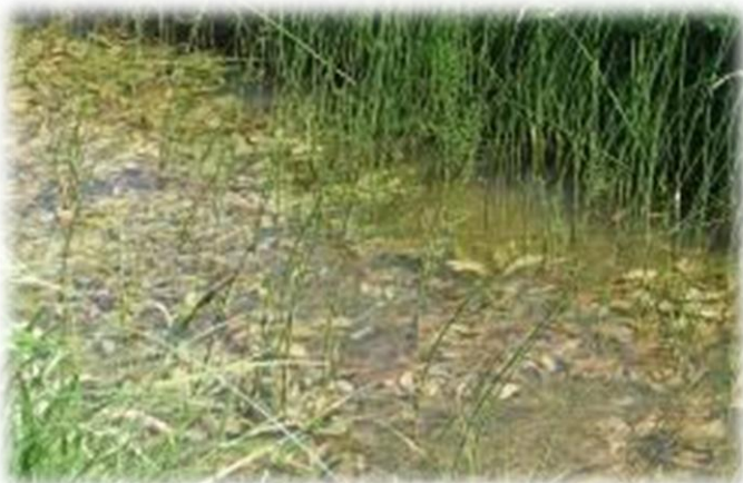
Soortenrijke slootvegetatie op landgoed Pax als gevolg van kwel

Voorts zou een sterke verhoging van het waterpeil in de Hooibroeken er ook toe kunnen leiden dat kwelwater in het gebied niet meer aan de oppervlakte komt. Veel sloten in de Hooibroeken zijn door de kleilaag heen gegraven en takken het grondwater aan. Het grondwater in de Hooibroeken beweegt zich in noordelijke richting, naar de Bergse Maas, en bouwt op plekken druk op waardoor het naar de oppervlakte gestuwd wordt. In de sloten in het gebied is dat duidelijk af te leiden aan de grote soortenrijkdom, waarvan sommige soorten indicatief zijn voor kwel. Het betreft kwelsoorten als Waterviolier, Grote boterbloem, Dotterbloem en Holpijp.