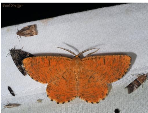
Oranje iepentak vlinder