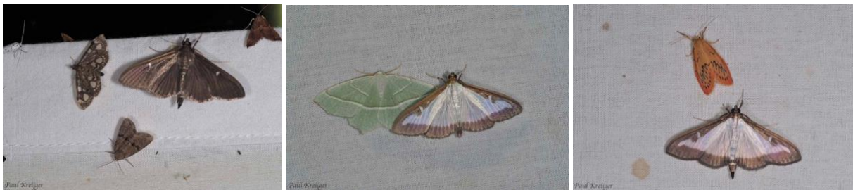
Buxusmot donkere vorm, samen met gewone coronamot, strooiselmot en een stippelmot, alle micro-vlinders De onderste vlinder, op deze foto, met dat donkere bandje op zijn vleugels is het zandhalmuiltje, is een uil, een macro-nachtvlinder.

De aantallen van de eikenprocessierups is laag, 6 mannetjes op het laken gehad, deze nacht.