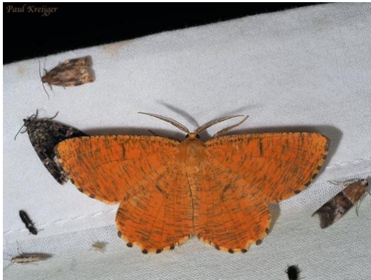
Oranje iepentak vlinder