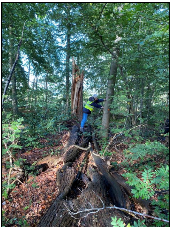
Staannd op een afgebroken rottende inlandse eik markeren van een Amerikaanse eik. Deze wordt bij de volgende dunning omgezaagd om de nog levende inlandse eiken van monumentale omvang groeiruimte te geven.