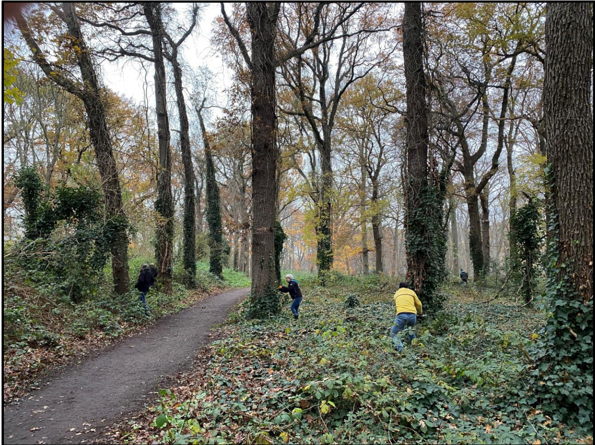
Werkzaamheden in het bos, ruimen van zwerfafval en verwijderen klimop uit de laanbomen met vrijwilligers.