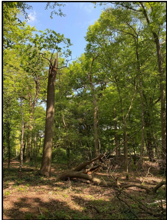
Waardevolle ecologische elementen in het boscosysteem. Afgestorven bomen, staand en liggend zoals groeiplaats voor schimmels, plek voor insecten, nestgelegenheid voor vogels en winterverblijf voor amfibien.