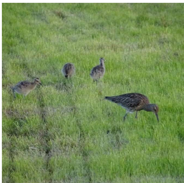
Gorseweide, wulp met 3 jongen (16 mei)

Met z'n allen vonden we tot en met 5 juni 143 (192) nesten. Hiervan zijn er 64 (=45%) uit, tot nu toe zijn er ook 43 (=30%) nesten verloren, te weten door werk (17x), predatie (22x) en verlaten (4x). Er worden nog 36 (=25%) legfels bebroed. Helaas noteerden we voor het tweede jaar op een rij een tot nu toe duidelijk lager aantal legfels dan in het voorgaande jaar rond deze tijd. Gelukkig zijn de verliezen door bewerkingen en vooral predatie een stuk lager. We verwachten in de komende weken geen nieuwe legfels meer te vinden en daardoor zal het eindbeeld van dit seizoen niet veel meer veranderen.