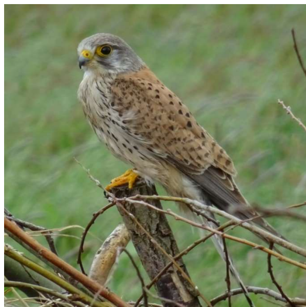
Torenvalk, Hooibroeksesteeg