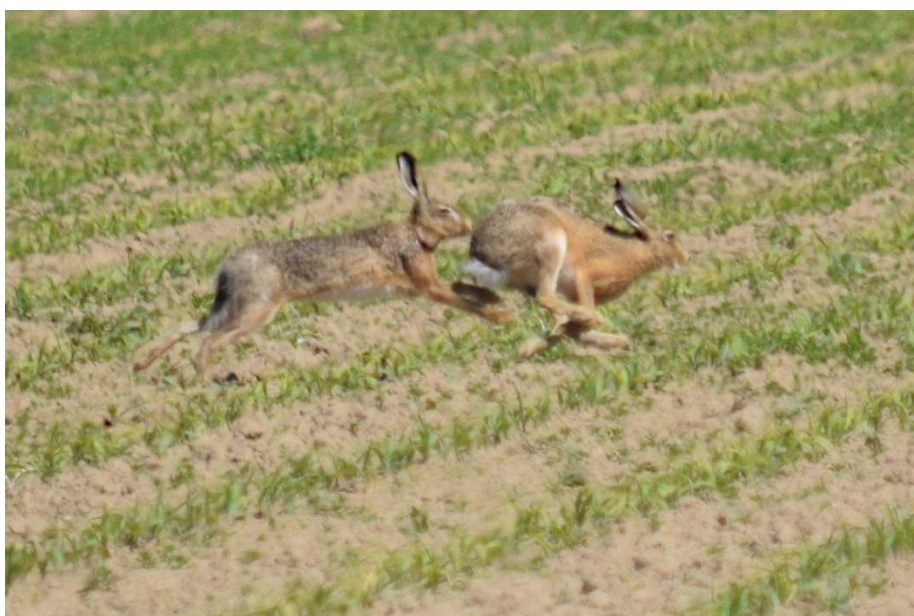
Hazen in actie