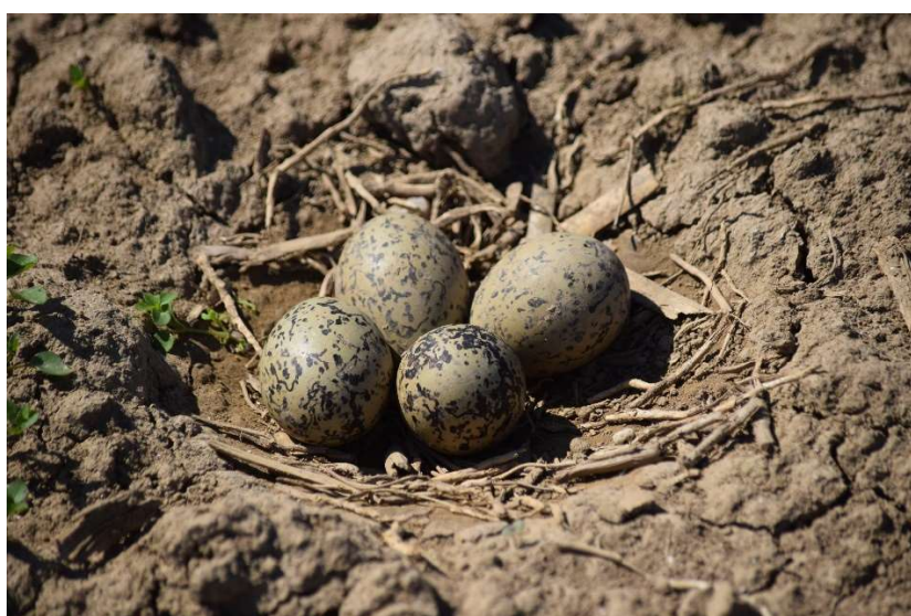
Scholeksterlegsels in Kievitsnest

Inmiddels zijn 37 Kievitslegsels uitgekomen. Het scholekster-nest en 13 Kievitslegsels worden nog bebroed. De overige 20 nesten zijn helaas verloren gegaan, 6 Kieviten en 1 scholekster door predatie, 10 Kieviten en 1 scholekster door werk en 2 Kievitsnesten zijn verlaten. Gelukkig is het predatieverlies (10%) een stuk lager dan vorig jaar, toen de vos behoorlijk huis hield en aan het einde van het seizoen zorgde voor 36% verlies.