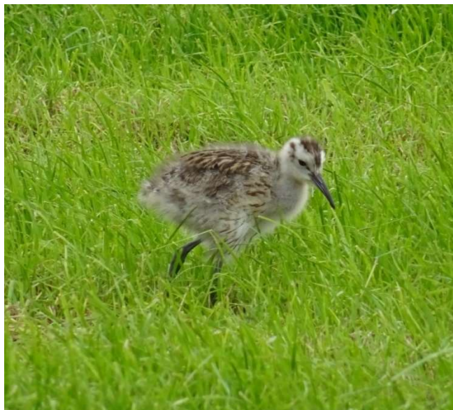
Wulpenjong (21 mei)