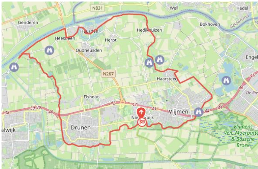
Fig. 1: Lange termijn plan: ring van nestkasten rondom Heusden

Het lange termijn plan is om langs de dijk rondom Heusden nestkasten op te hangen, zoals aangegeven in fig. 1. Daarna zal deze ring worden verbonden met andere natuurgebieden, bijv. de Drunense Duinen.